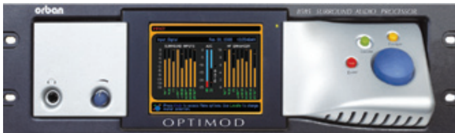
Процессор Optimod 8585

Optimod 8585. Новый многоканальный цифровой процессор обработки звука для цифрового радиовещания, цифрового телевидения и других применений. Сочетает все возможности двухканального процессора Optimod 6300 с обработкой многоканального звука для 7.1- или