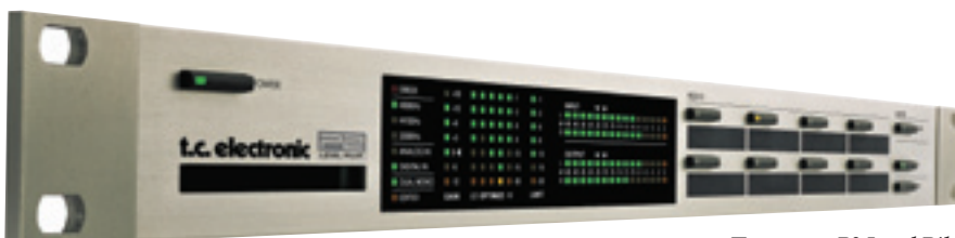
Процессор P2 Level Pilot