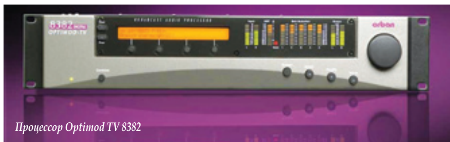
Процессор Optimod TV 8382

обработке в пяти частотных полосах. Предусмотрены развитая система автоматической регулировки усиления, энхансер и эквалайзер, а также набор готовых пресетов для обработки звука. Дистанционное управление – через два