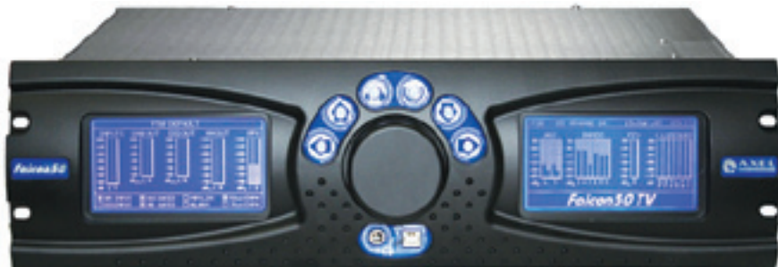
Процессор Falcon 50TV

Falcon 35 TV. Двухканальный цифровой аудиопроцессор для ТВ-вещания, может переключаться на два независимых моноканала. Полоса частот до 15 кГц с ФНЧ. Полностью цифровая обработка сигналов, интеллектуальный лимитер. Архитектура основана на