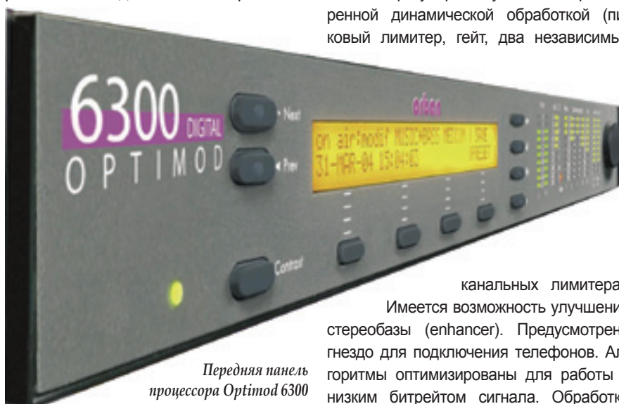
Передняя панель процессора Optimod 6300

Выходы – цифровые и аналоговые XLR. Разрядность выходного сигнала – 24, 20, 18, 16 или 14 бит, частота дискретизации – 32; 44,1; 48; 88,2 или 96 кГц (синхронно с входным сигналом или не-