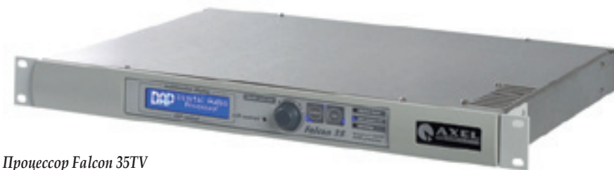
Процессор Falcon 35TV

последовательных порта RS-232, ПО для управления под ОС Windows.